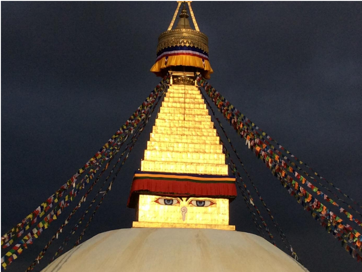
Foto: Stupa in Bouddhanath in Kathmandu