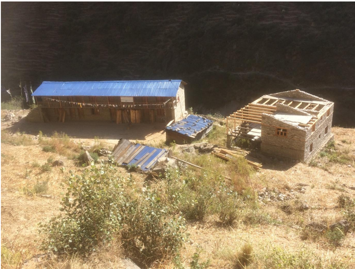
Foto: overzicht school en in aanbouw zijnde hostel in Dunggadara, oktober 2017

House of Dreams Foundation heeft verder geen schulden. Er zijn diverse rekeningen die door Toon zijn voorgesloten in 2017 en in 2018 terug betaald.