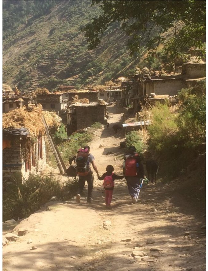
Foto: Onderweg naar Dunggadara, oktober 2017

Als een ANBI zich niet aan deze verplichtingen houdt, kan dat betekenen dat de instelling niet meer als een ANBI wordt aangewezen. Ook kan het zijn dat de status van ANBI met terugwerkende kracht wordt ingetrokken. Dit kan fiscale gevolgen hebben.